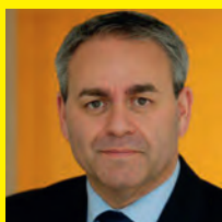
XAVIER BERTRAND Président du conseil régional des Hauts-de-France