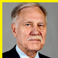
DOMINIQUE RIQUET Député européen