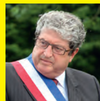
GUY BUSTIN Maire de Vieux-Condé